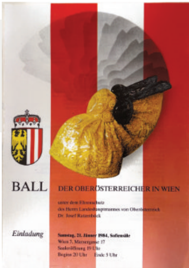
Offizielle Einladung aus 1984